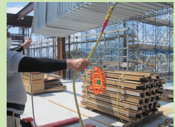
地切り確認をした後に、吊荷警報器のスイッチを入れます。