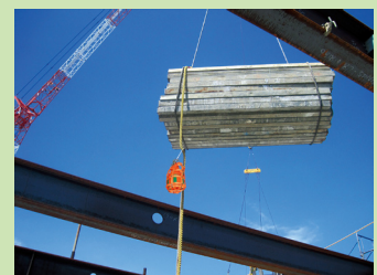
吊り荷が移動中、警報音と音声によって、吊荷直下に注意を促します。