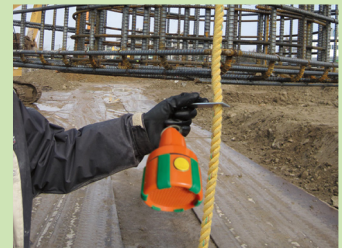
介錯ロープ用金具を水平に持って、吊り荷の高さに合わせて上下移動させながら位置調整をします。